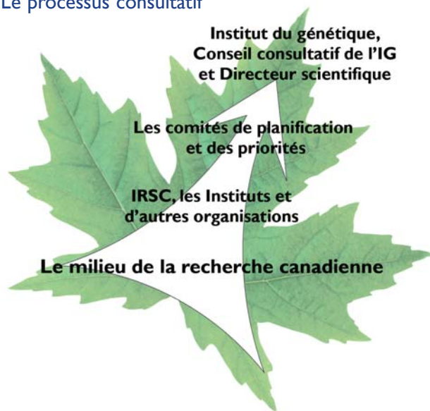
Figure 2. Le processus consultatif

« Orientations stratégiques : Consultation de notre milieu », publié en septembre 2002. Ce projet a été modifié encore lors d'une journée de planification stratégique tenue en septembre 2002 (Aylmer, Québec), à laquelle ont assisté une soixantaine de chercheurs, d'universitaires et de responsables des politiques publiques et scientifiques dans les domaines de la génétique, de la biochimie, de la biologie cellulaire et des sciences sociales. Les six thèmes de recherche prioritaires suivants ont été dégagés du processus de consultation de la base et adoptées par CCI :