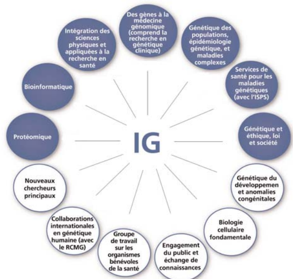
Figure 4. Comité de planification et des priorités et groupe de travail de l'IG

Le leadership de l'Institut de génétique est largement répandu dans l'ensemble du Canada. Les cercles en bleu indiquent les comités de planification et d'établissement des priorités qui soutiennent la stratégie des thèmes prioritaires de l'Institut de génétique et les cercles blancs indiquent les comités de planification et d'établissement des priorités qui soutiennent la stratégie habilitante de l'IG.